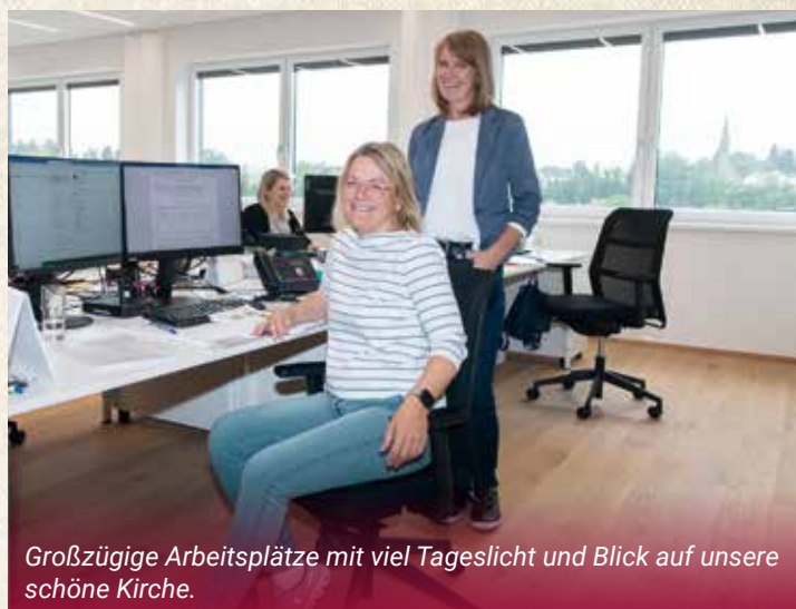
Großzügige Arbeitsplätze mit viel Tageslicht und Blick auf unsere schöne Kirche.