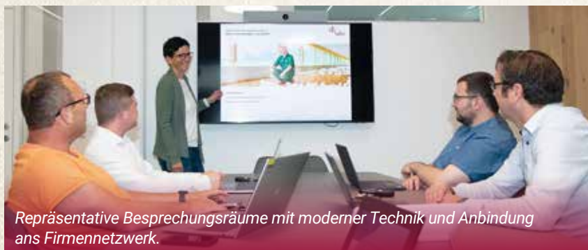
Repräsentative Besprechungsräume mit moderner Technik und Anbindung ans Firmennetzwerk.