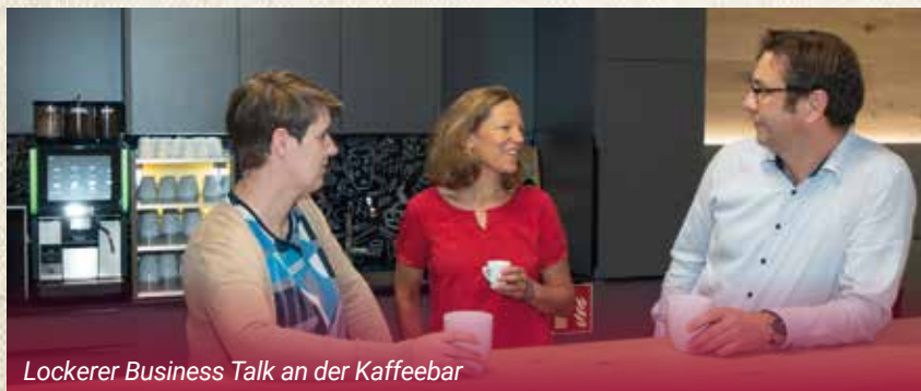
Lockerer Business Talk an der Kaffeebar

Im Sommer sorgt die Deckenkühlung für ein angenehmes Klima. Dekorative Grünpflanzen lockern die Räumlichkeiten auf und sorgen für einen grünen Touch.