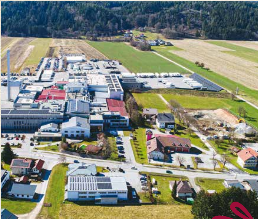
Erweiterung am ehemaligen „Holzner“-Gelände und darüber hinaus.