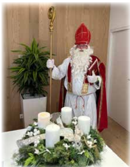
Nikolausbesuch im Gemeindeamt

Titelfoto: Winterlandschaft an der Mattig